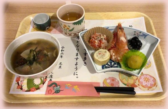
ゆうしゃいん庄原

毎年三が日の朝はおせちを提供しています。お雑煮も鰯や鶏肉など具材を変えて3日間提供しています。